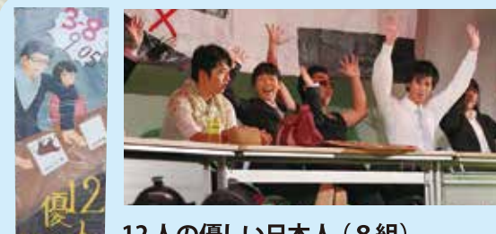
12人の優しい日本人 (8組) 僕は人を引っ張るというタイプではないので上手く皆をまとめることができず、本番2日前のリハーサルはボロボロでした。でもその後、皆が協力してくれたので何とか仕上げることができました。本当に皆には感謝がいっぱいです。