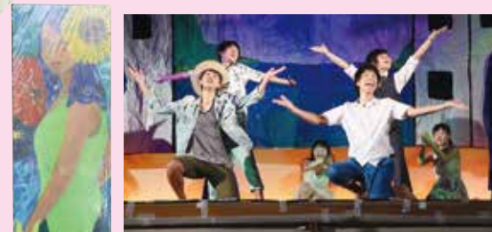
MAMMA-MIA! (1組) 受験勉強の中、クラスをまとめて引っぱっていくのが本当に難しかったです。練習に全然来なかったりする人もいっぱいいて、本番3日前までとって焦りました。本番には、なんとか全員が本気で舞台上に臨むことができました。