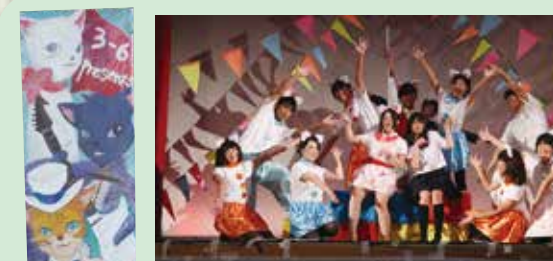
猫の音返し (6組) 出演者が多かったので練習があまりできなかったり、リハーサルの度に問題点がでてきたりと大変なことたくさんありました。本番では今までの苦労が吹飛ばすほどの楽しい劇ができたのでとても楽しかったです。