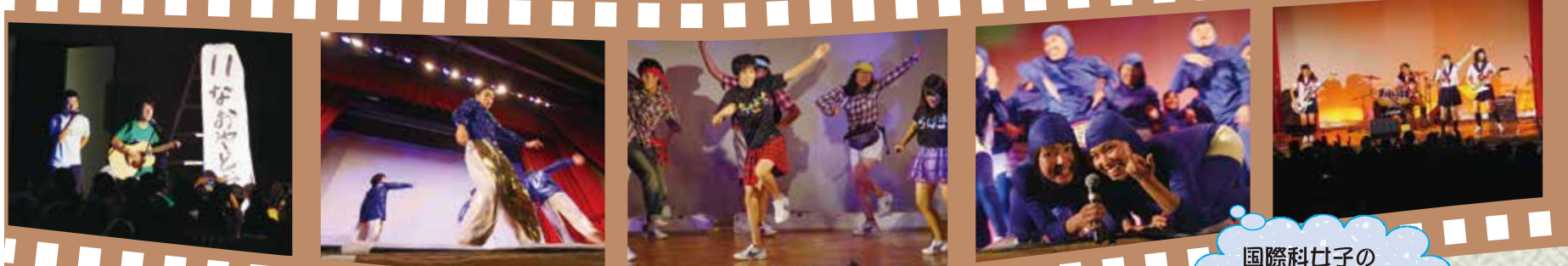
国際科女子の「もじゃっ子」