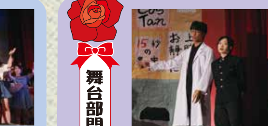
理系メン パラダイス (9組) 文化委員を中心に準備をしてきましたが、本番前になるとあまり進んでいないことがわかり、みんなでひとつになって進めていくことができました。「笑いあり、涙あり」を基盤とした学園ラブストーリーは僕たちが小さいときから高校生になったらこんなことがあるんだろうな、と思っていたことだったので練習中もみんな後に入りこむのが上手でした。音響、照明の努力には脱帽です。