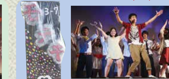
モテキ (7組) 今年の文化祭は最高でした！体育祭と一緒に頑張ったNAVY団がたくさん観に来てくれて、ずっと笑いも絶えなくて、とても嬉しかったです。ギリギリまで動作とかいる悩んでいたけれど、面白い劇をみんなで作ることが出来ました！！