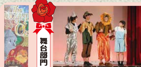
オズの魔法使い (4組) 大変だったことは、体育祭ほどクラスが盛り上がってなかったこと、受験と忙しなかたが協力してもらったのが健で、文化祭が近づくにつれやる気が増したので、とてもよい作品が作れました。