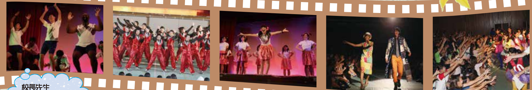
校長先生 じえじえじえ!!